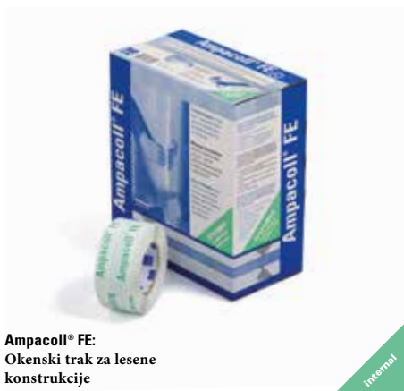
Ampacoll® FE: Okenski trak za lesene konstrukcije