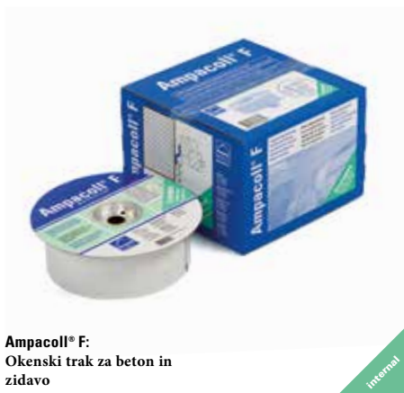
Ampacoll® F: Okenski trak za beton in zidavo