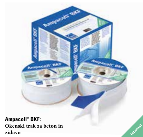
Ampacoll® BKF: Okenski trak za beton in zidavo